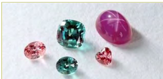
「ビズー」が取り扱う人工カラーストーン 6月の誕生石「アレキサンドライト」(中央)、 7月「ルビー」(右上)、9月「サファイア」(左端・右下)

新発売の9月の誕生石「サファイア」のほかで、6月の誕生石「アレキサンドライト」、7月の誕生石「ルビー(スタールビー)」を、「ラボグロウン・シリーズ」から展開しています。