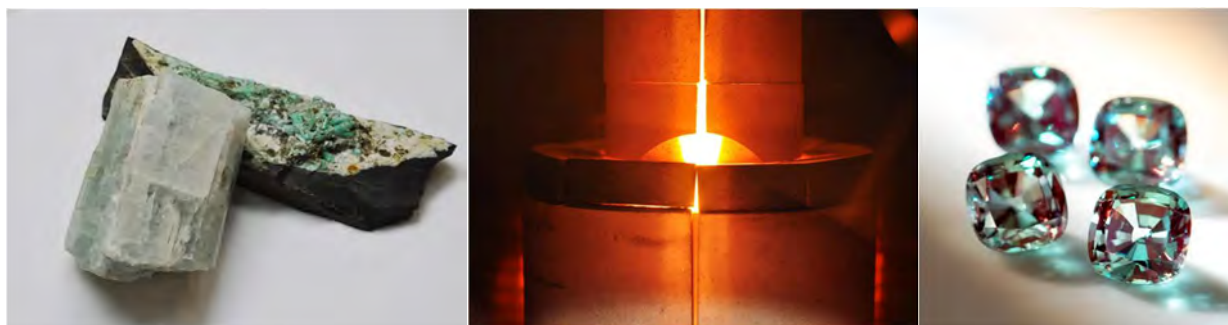
天然の原鉱石を専用の炉に入れて、天然石が自然のマグマの中で生成される過程を忠実に再現再結晶化させることで、時間をかけて宝石に育成していきます 写真左、中央は、「エメラルド」の原鉱石と製造過程。写真右はラボグロウン・アレキサンドライト

今回は豊富な原鉱石を人工的に育成することで生まれる「ラボグロウン・カラーストーン」を製品化し、「宝石ロス」削減に取り組みます。