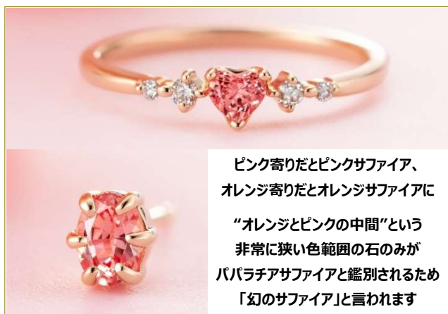
ピンク寄りだとピンクサファイア、 オレンジ寄りだとオレンジサファイアに “オレンジとピンクの中間”という 非常に狭い色範囲の石のみが パパラチアサファイアと鑑別されるため 「幻のサファイア」と言われます

オレンジとピンクの中間の色味が絶妙な天然の「パパラチアサファイア」は、“幻のサファイア”と呼ばれる希少石です。シンハラ語で「蓮の花の色」を意味する「パパラチア」の輝きが、手元や耳元を華やかにします。